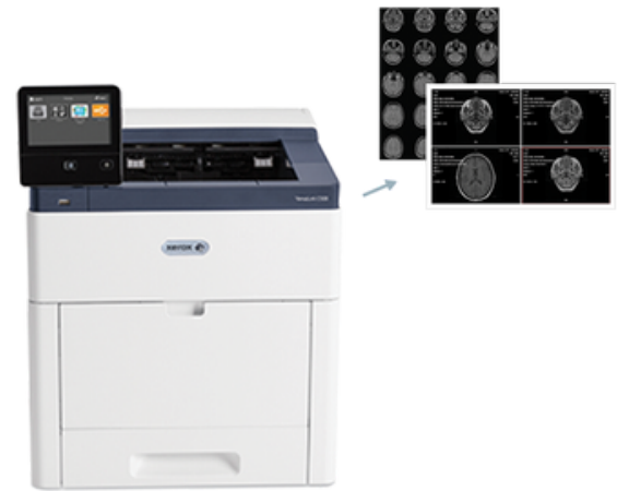
Support de plusieurs modes d'imprimantes